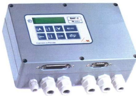
Рисунок 1 – Общий вид вычислителя

Общий вид вычислителя приведен на рисунке 1.